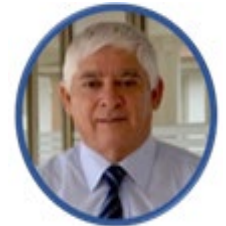
Director de sigweb.cl